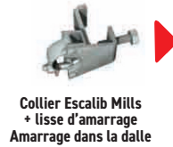
Collier Escalib Mills + lisse d'amarrage Amarrage dans la dalle